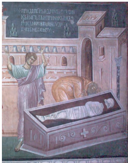
Апостолы Пётр и Иоанн у гроба Спасителя. Фреска в монастыре Грачаница, Сербия. XVI в.

«Сей ученик и свидетельствует о сем, и написал сие; и знаем, что истинно свидетельство его. Многое и другое сотворил Иисус; но, если бы писать о том подробно, то, думаю, и самому миру не вместить бы написанных книг. Аминь» (Ин. 21, 24–25).