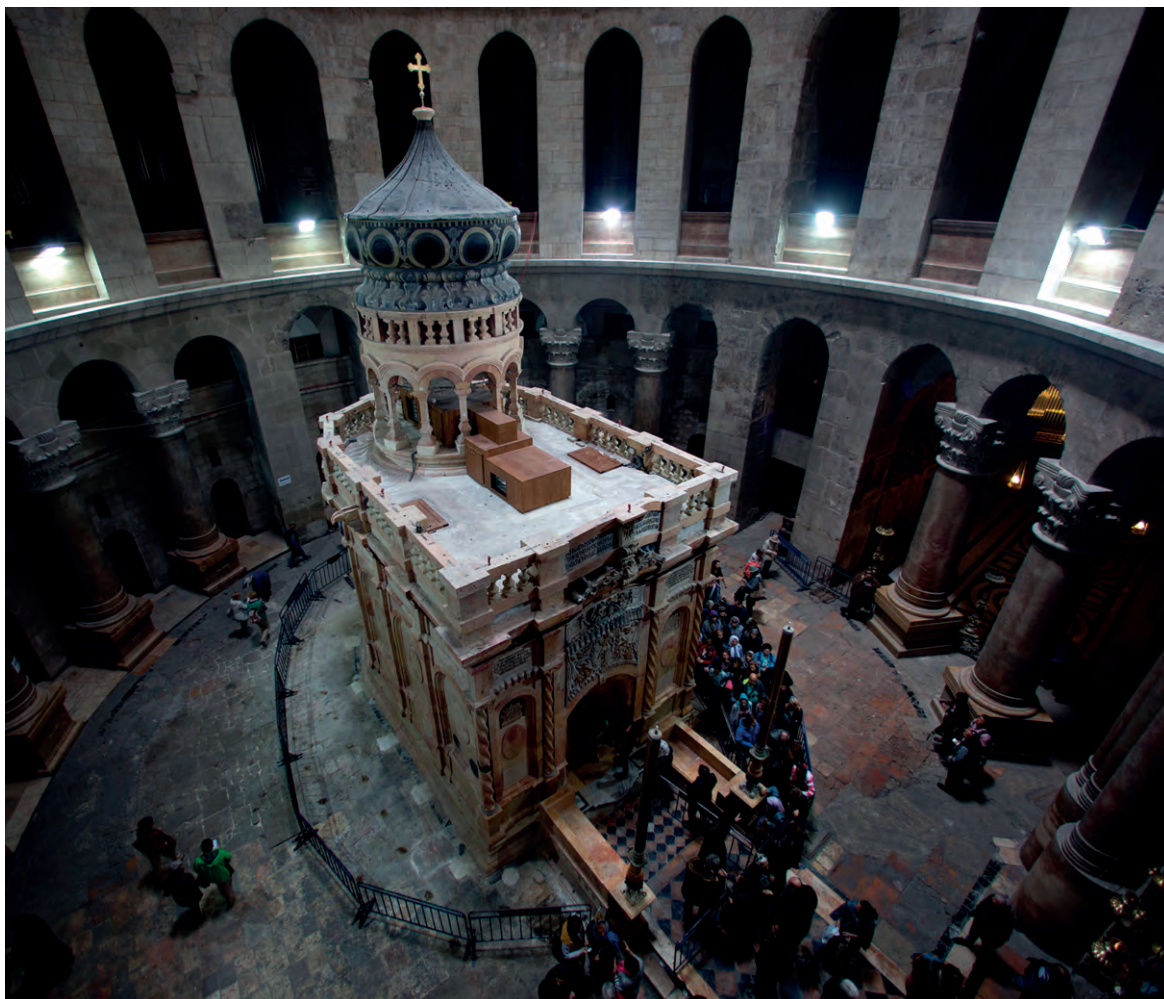
Кувуклия – часовня Гроба Господня. Храм Воскресения Христова. Иерусалим

Твой живоносный гроб, источник нашего воскресения, Христе, сделался по истине вожделеннее рая и прекраснее всякаго царского чертога.