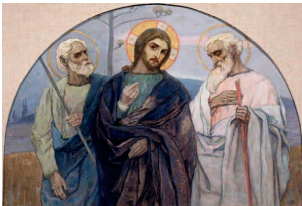
На пути в Эммаус. Художник М. Нестеров. 1897 г.

Тогда Лука и Клеопа стали рассказывать о том, что ожидаемого ими Христа Спасителя осудили на смерть и распяли. Уже третий день, как всё это произошло.