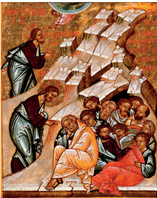
Гефсиманская молитва. Икона

что Иисус Христос есть истинный Человек, потому что человеческой природе свойственно бояться смерти. Молился Христос до кровавого пота, «и был пот Его, как капли крови, падающие на землю» (Лк. 22, 44).