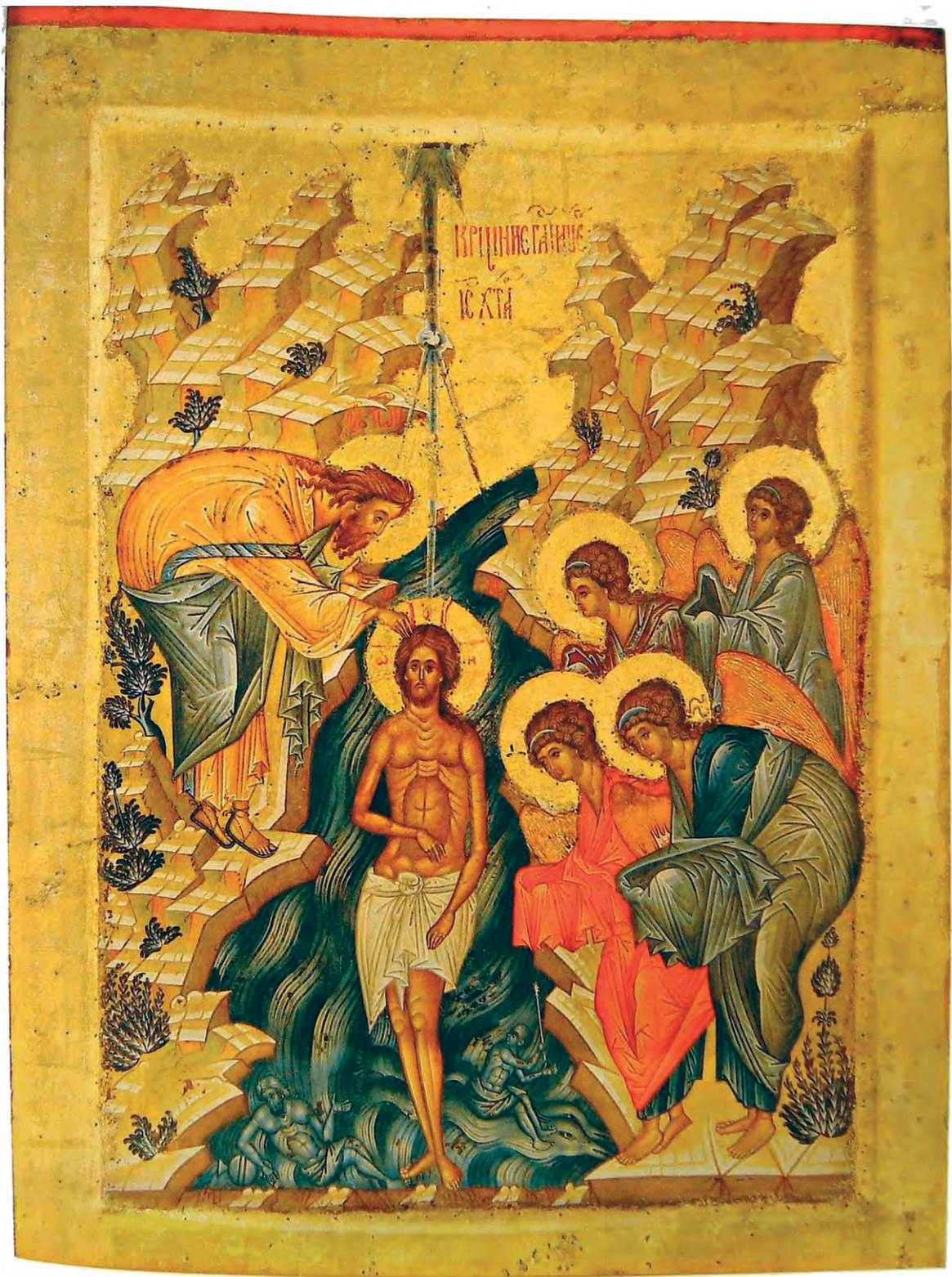
Крещение Господне. Икона. XV в.