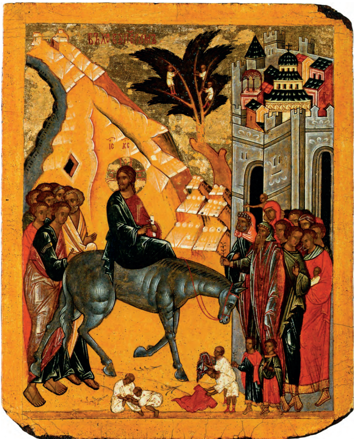
Вход Господень в Иерусалим. Икона