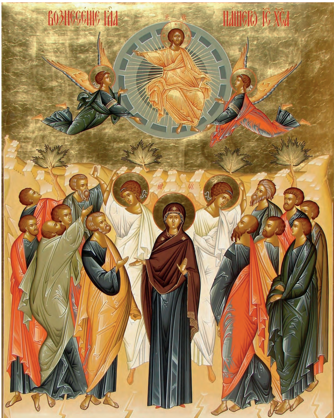
Вознесение Господне. Икона