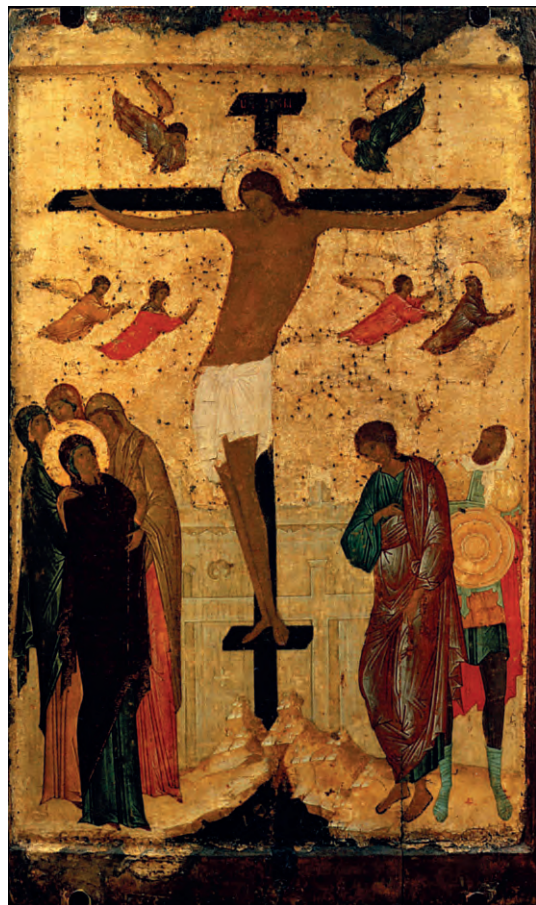
Распятие. Икона. Дионисий

«Тогда наконец он предал Его им на распятие. И взяли Иисуса и повели. И неся крест Свой, Он вышел на место, называемое Лобное, по-еврейски Голгофа; там распяли Его и с Ним двух других, по ту и по другую сторону, а посреди Иисуса. Пилат же написал и надпись, и поставил на кре-