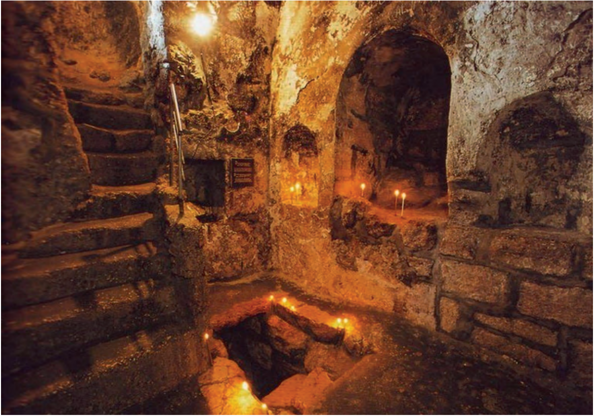
Гробница праведного Лазаря. Вифания. Святая Земля

Отче! благодарю Тебя, что Ты услышал Меня. Я и знал, что Ты всегда услышишь Меня; но сказал сие для народа, здесь стоящего, чтобы поверили, что Ты послал Меня.