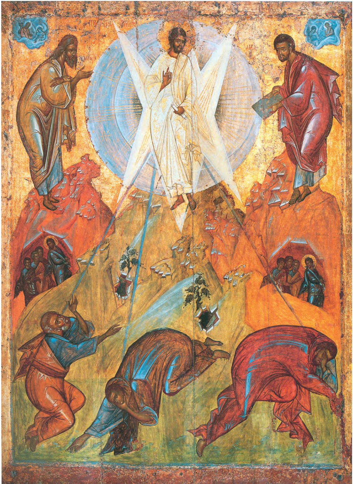
Преображение Господне. Икона