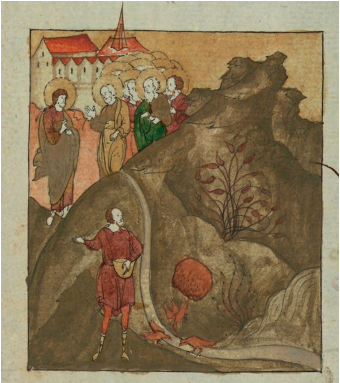
Притча о сеятеле. Миниатюра

А посеянное в тернии означает того, кто слышит слово, но забота века сего и обольщение богатства заглушает слово, и оно бывает бесплодно.