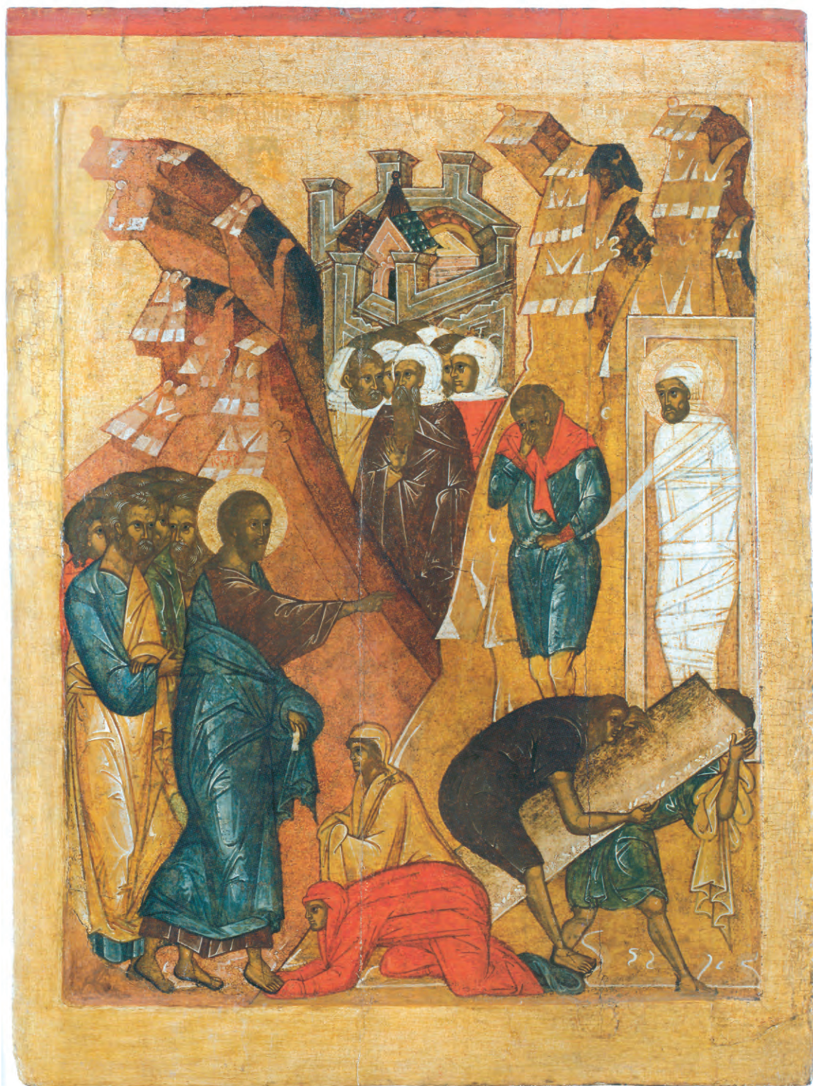
Воскрешение праведного Лазаря. Икона. XVI в.