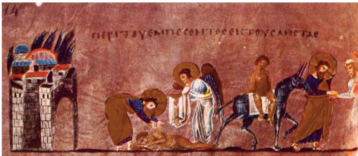
Притча о милосердном самарянине. Миниатюра