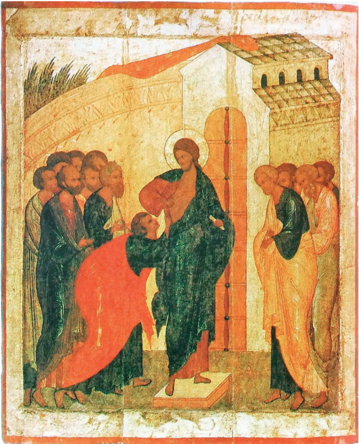
Уверение апостола Фомы. Икона. Дионисий