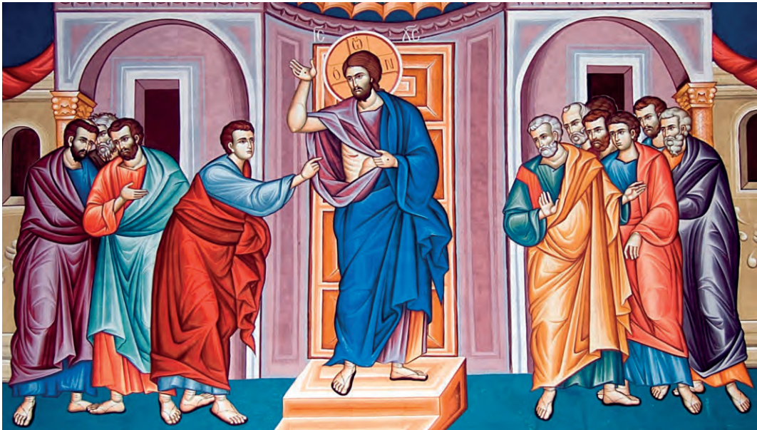
Воскресший Христос среди апостолов. Икона

дей. И сказал, что дух плоти и костей не имеет. Изумлённые апостолы от радости всё ещё не верили, что перед ними воскресший Христос. Он спросил тогда: есть ли у них какая пища? Ученики подали печёной рыбы и мёд, и Он разделил с ними эту апостольскую трапезу.