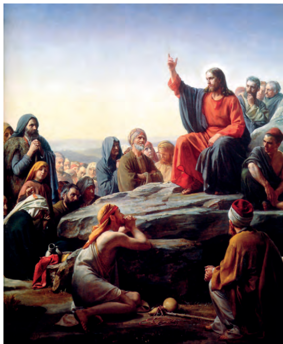
Нагорная проповедь. Художник К. Блох

Блаженство — это не просто счастье, а счастье быть с Богом, жить по Его святой воле и всегда радоваться о спасении в Царстве Божиим.