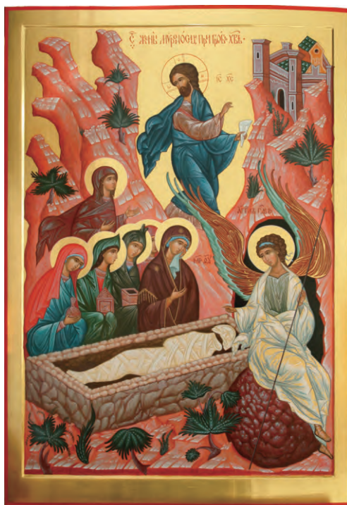
Жены-мироносицы у Гроба Господня. Икона

Так повествует о женах-мироносицах, рано утром пришедших ко Гробу Христа Спасителя, святой евангелист Марк. Евангелисты Матфей, Лука и Иоанн сохранили свидетельства о явлениях воскресшего Господа нашего Иисуса Христа женам-мироносицам и ученикам Христовым.