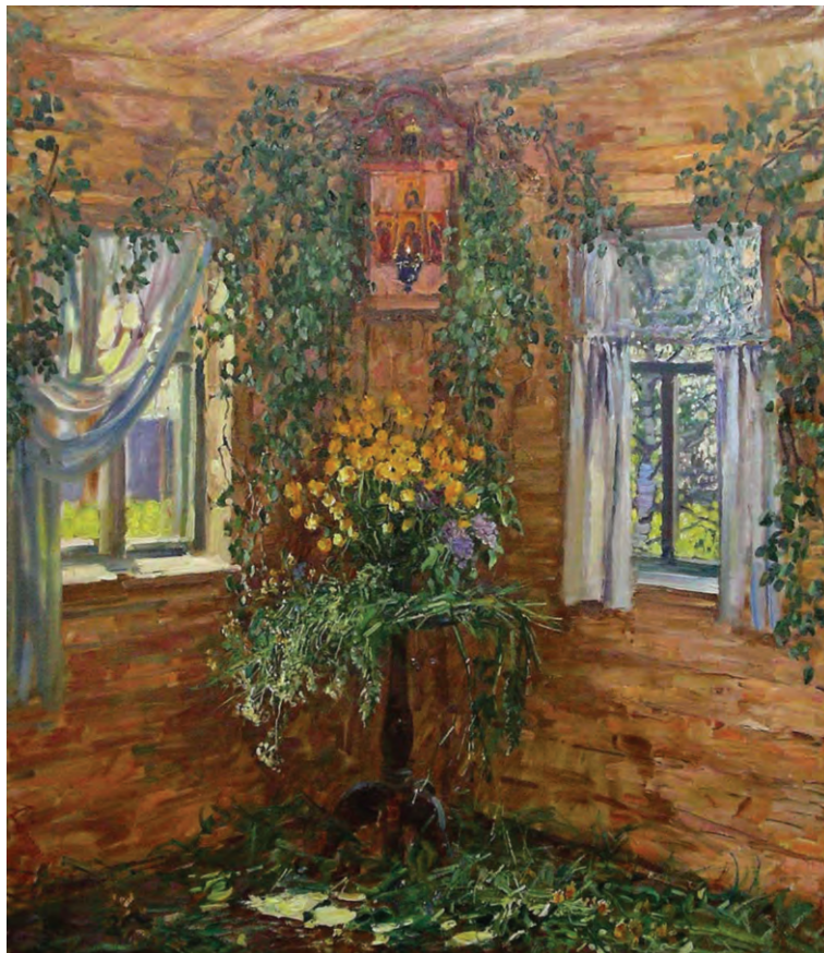
На Троицу. Художник М.Абакумов