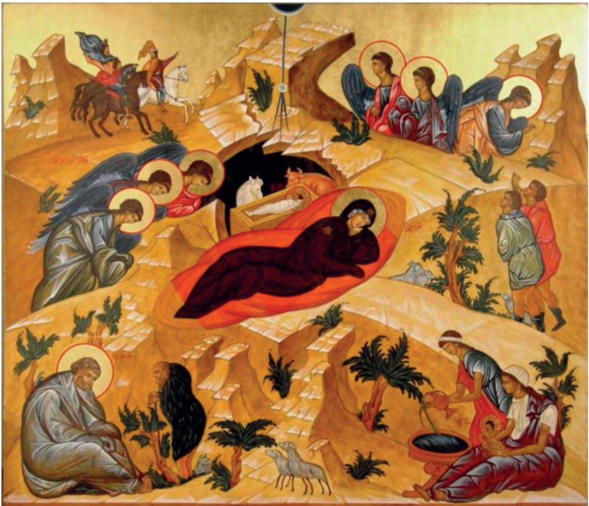
Рождество Христово. Икона

лись страхом великим. И сказал им Ангел: не бойтесь; я возвещаю вам великую радость, которая будет всем людям: ибо ныне родился вам в городе Давидовом Спаситель, Который есть Христос Господь; и вот вам знак: вы найдете Младенца в пеленах, лежащего в яслях.