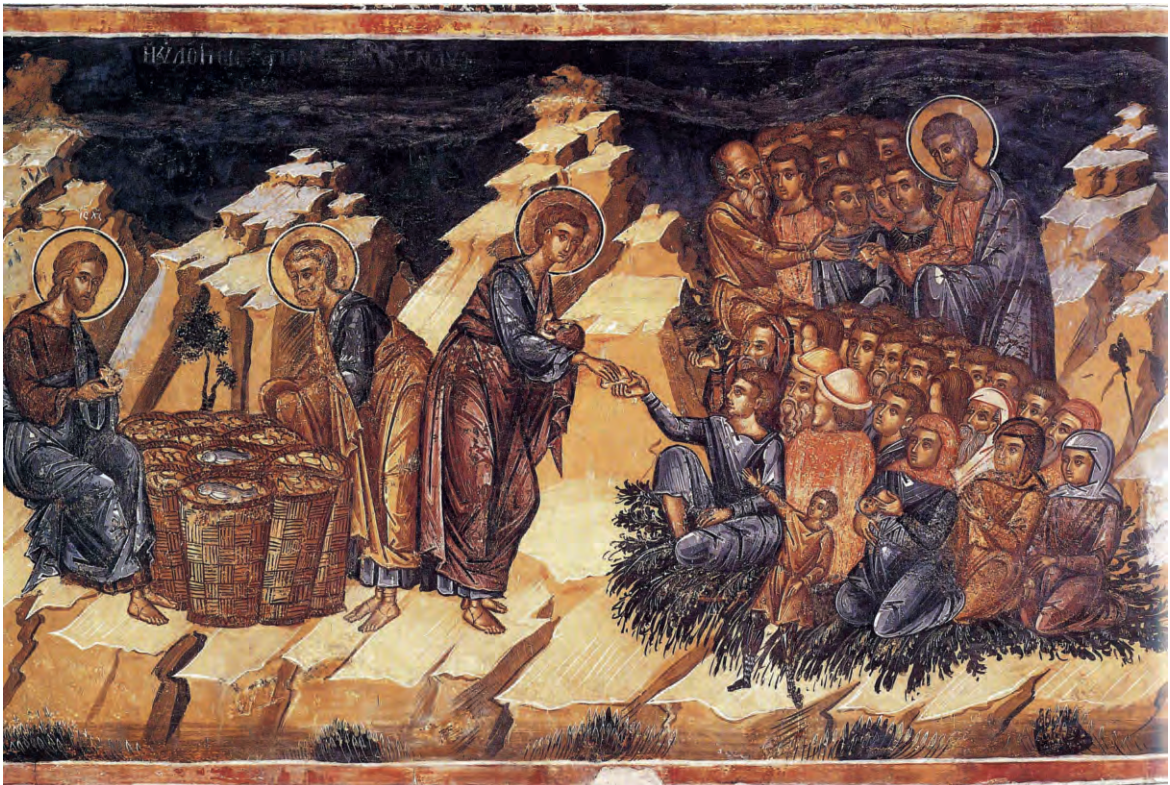
Чудо насыщения пяти тысяч человек пятью хлебами. Фреска

Иисус сказал: велите им возлечь. Было же на том месте много травы. Итак возлегло людей числом около пяти тысяч.