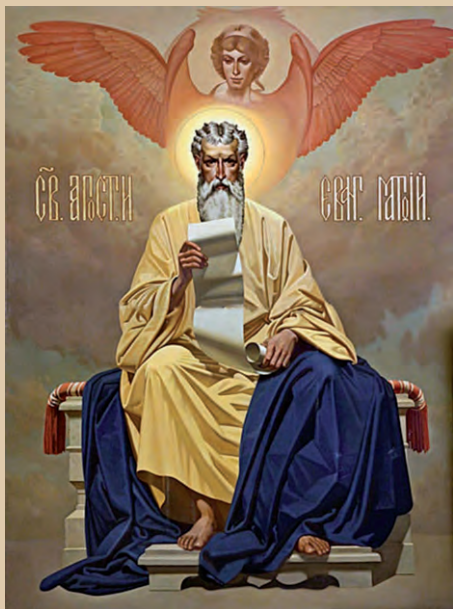
Апостол и евангелист Матфей

Если написано (Мф. 28, 16–20), то это означает указание на 16–20 стихи 28-й главы Евангелия от Матфея. Стихи эти составляют 116-е зачало Евангелия от Матфея, которое мы и читаем на нынешнем уроке. Это зачало называется первым воскресным евангельским зачалом .