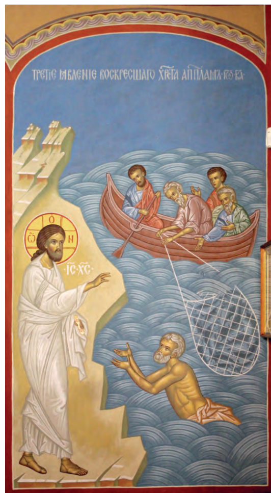
Третье явление воскресшего Христа апостолам. Фреска в монастыре Марии Магдалины на берегу Тивериадского озера

«Пошли и тотчас вошли в лодку, и не поймали в ту ночь ничего. А когда уже настало утро, Иисус стоял на берегу; но ученики не узнали, что это Иисус» (Ин. 21, 3–4). Как прежде Луке и Клеопе, воскресший Христос явился ученикам «в ином образе» (Мк. 16, 12) и не сразу открылся им. Он спросил: «Дети! Есть ли у вас какая пища?» Те ответили, что нет. Он тогда сказал им: «Закиньте сеть по правую сторону лодки, и поймаете» (Ин. 21, 5–6).