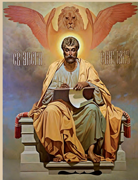
Апостол и евангелист Марк