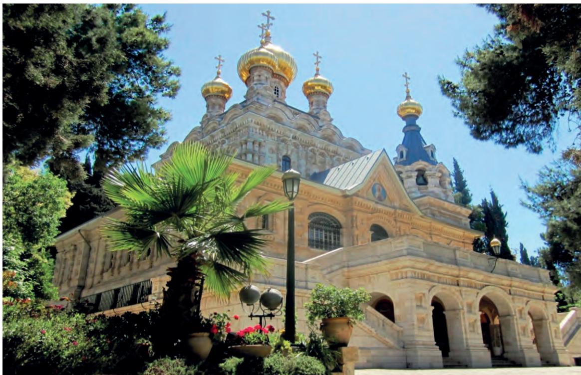
Храм Марии Магдалины. Иерусалим

Расскажите , какая пасхальная традиция, сохранившаяся до наших дней, связана со святой Марией Магдалиной.