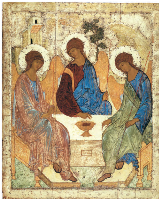
Святая Троица. Икона. Преподобный Андрей Рублёв

В воспоминание Сошествия Святого Духа на апостолов Церковь Православная празднует Новозаветную Пятидесятницу. Этот великий праздник мы называем Днём Святой Троицы .