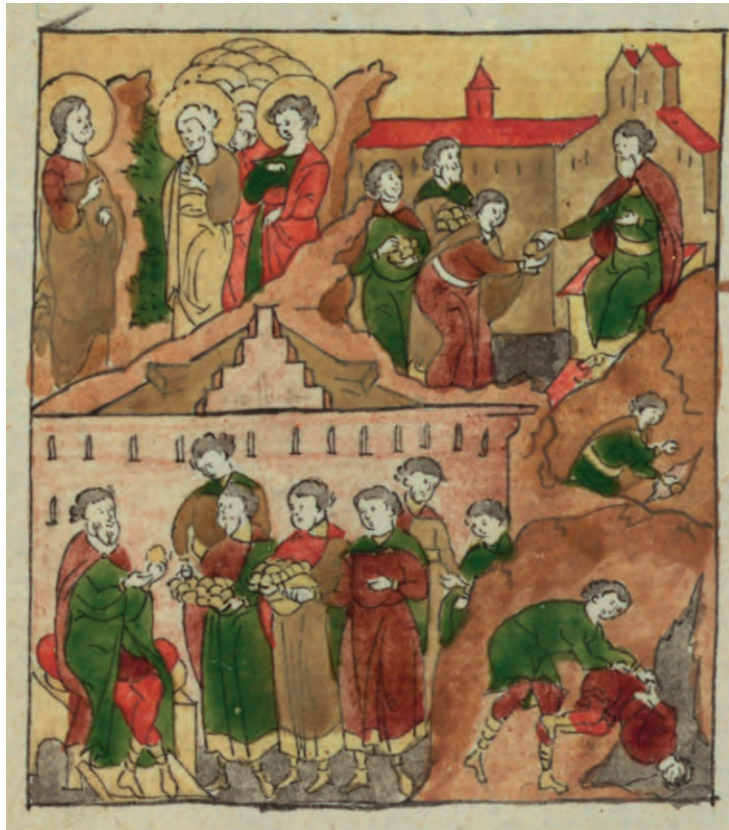
Притча о талантах. Миниатюра

вания — всё это таланты от Бога, которые даются человеку для преумножения. Значит, к таланту нужно приложить собственный труд и большое усердие. Человек, который не хочет трудиться и умножать данный Богом талант, зарывает свой талант в землю.