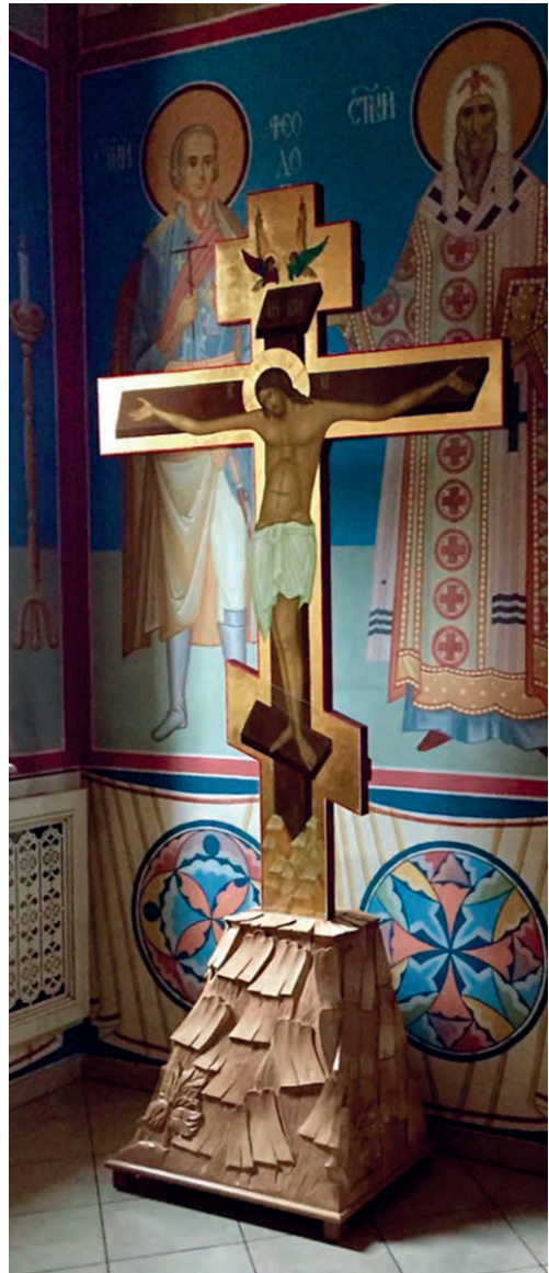
Крест-Голгофа в храме

Когда Иисус Христос умер на Кресте, в Иерусалимском храме раздралась надвое сверху до низу священная завеса. Завершился Ветхий Завет и вступил в силу Новый Завет, возвещённый Христом на Тайной Вечери.