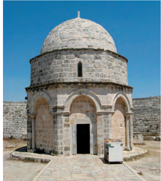
Часовня на месте вознесения Иисуса Христа. Иерусалим

Ученики Христовы хорошо помнили о заповеди, которую дал им воскресший Христос: «Идите, научите все народы, крестя их во имя Отца и Сына и Святаго Духа, уча их соблюдать все, что Я повелел вам; и се, Я с вами во все дни до скончания века» (Мф. 28, 19–20). Поэтому, получив в день Новозаветной Пятидесятницы изобильно благодать Святого Духа, они пошли по