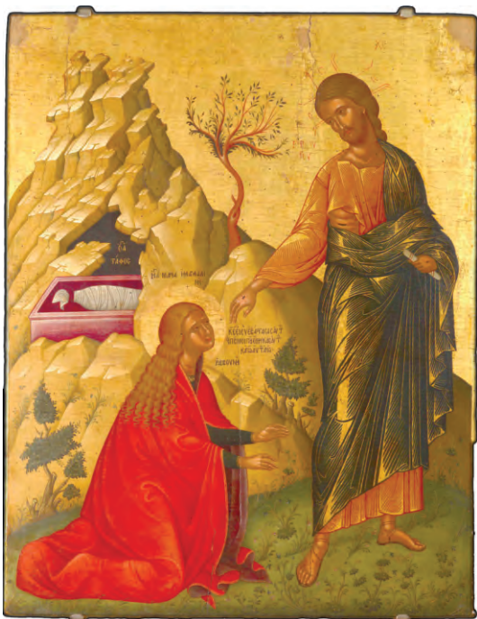
Явление воскресшего Христа Марии Магдалине. Икона

В восторге и радости Мария Магдалина упала к ногам воскресшего Христа. Христос же, утешив Марию Магдалину Своим явлением, сказал ей: «Не прикасайся ко Мне, ибо Я еще не восшел к Отцу Моему; а иди к братьям Моим и скажи им: восхожду к Отцу Моему и Отцу вашему, и к Богу Моему и Богу вашему» (Ин. 20, 17).