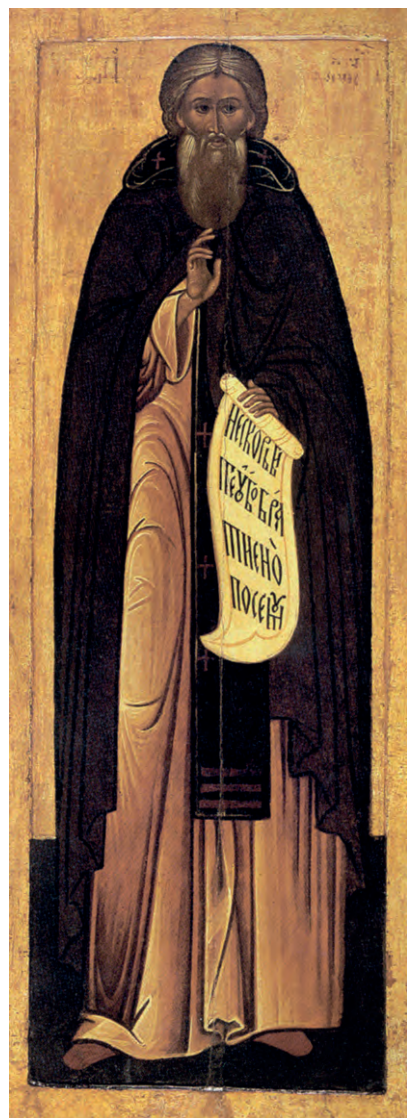
Преподобный Сергий Радонежский. Икона

Будем с Божией помощью стараться чаще читать Святое Евангелие!