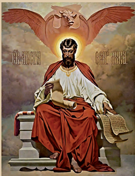
Апостол и евангелист Лука