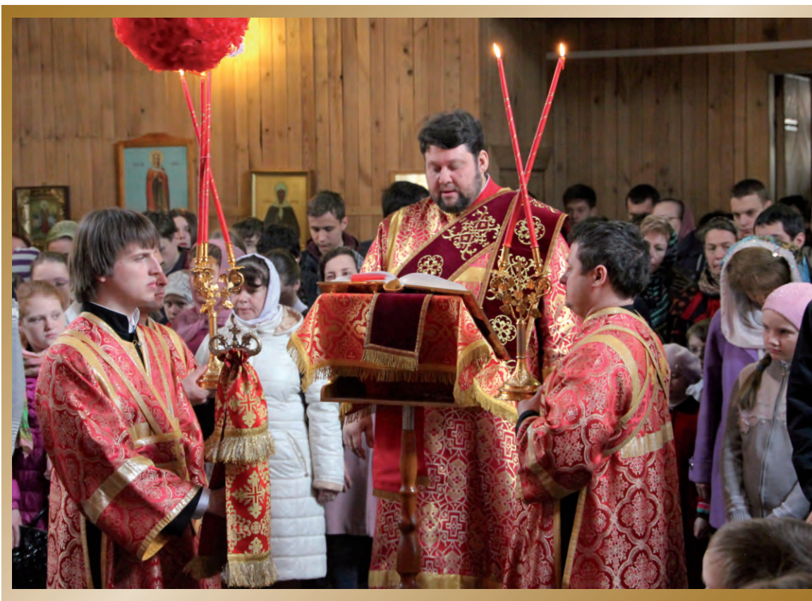
Чтение Евангелия на Божественной Литургии

На занятиях по основам православной веры мы будем осваивать Евангелие по зачалам. Первые одиннадцать уроков мы будем читать и слушать те зачала, которые весь год поочерёдно читаются в храме на воскресной службе, начинающейся в субботу вечером. Всего таких воскресных евангельских зачал одиннадцать. В них евангелисты повествуют о явлениях воскресшего Господа нашего Иисуса Христа женам-мироносицам и апостолам. Затем мы будем читать и слушать те зачала, которые читаются в храме на великие церковные праздники, а также некото-