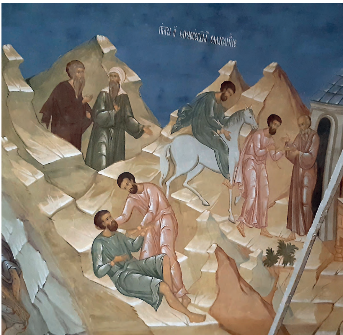
Притча о милосердном самарянине. Фреска

Христос законника. Тот ответил: «Оказавший ему милость» . Тогда Иисус сказал: «Иди, и ты поступай так же» (Лк. 10, 35–37).