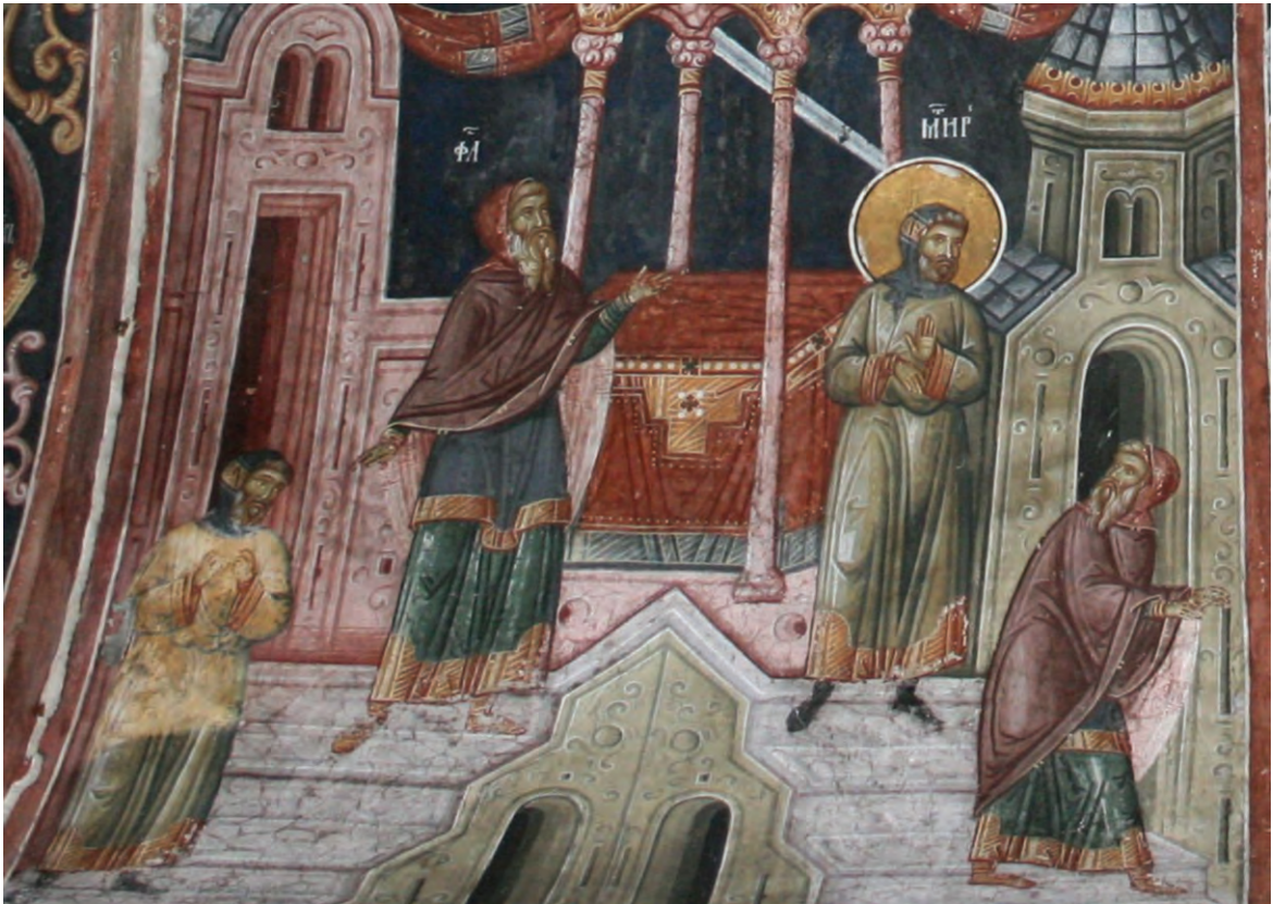
Притча о мытаре и фарисее. Фреска

Фарисей — это ревностный исполнитель требований закона Моисеева. Но одного лишь внешнего исполнения предписаний закона недостаточно, как это показала притча, сказанная Иисусом Христом.