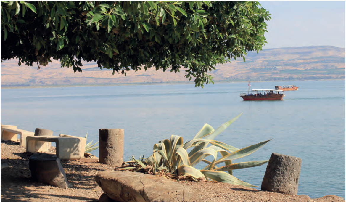
На озере Тивериадском

закинули сети, то рыбы оказалось столь много, что даже порвались сети и лодки начали тонуть. Призывая братьев Андрея и Петра на апостольское служение, Иисус Христос сказал им: «Идите за Мною, и Я сделаю, что вы будете ловцами человеков» (Мк. 1, 17).