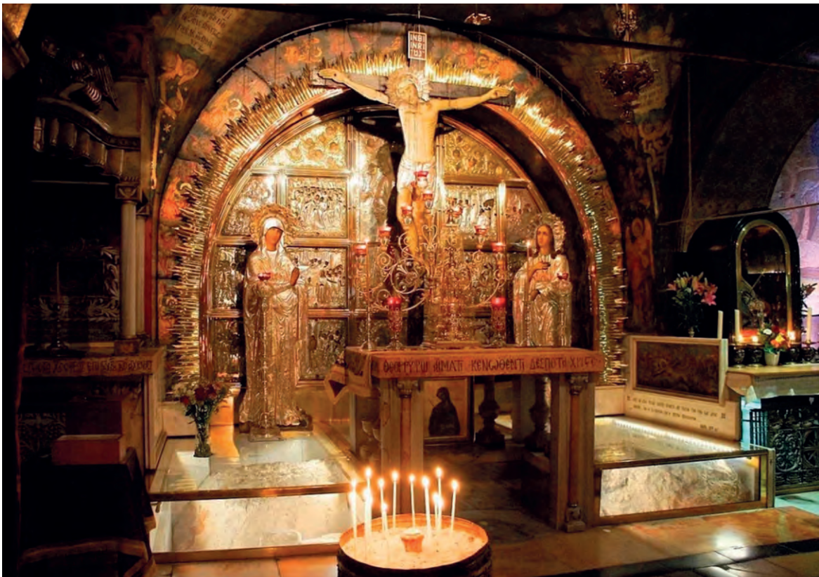
Голгофа. Храм Воскресения Христова. Иерусалим

от Христа: «Истинно говорю тебе, ныне же будешь со Мною в раю» (Лк. 23, 43).