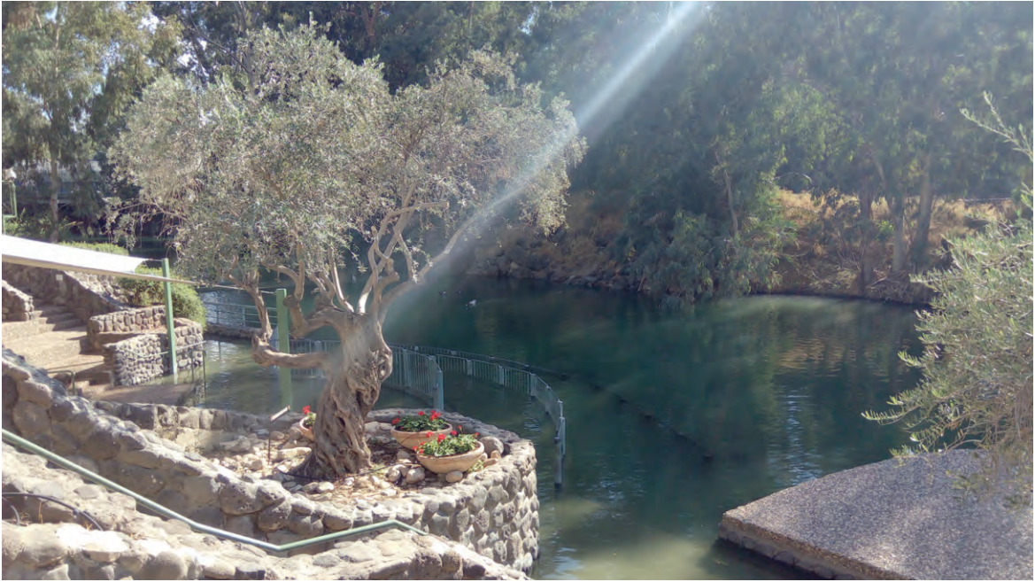
На реке Иордан

слова «крещение». Об этом свидетельствуют тропарь и кондак праздника Крещения Господня.