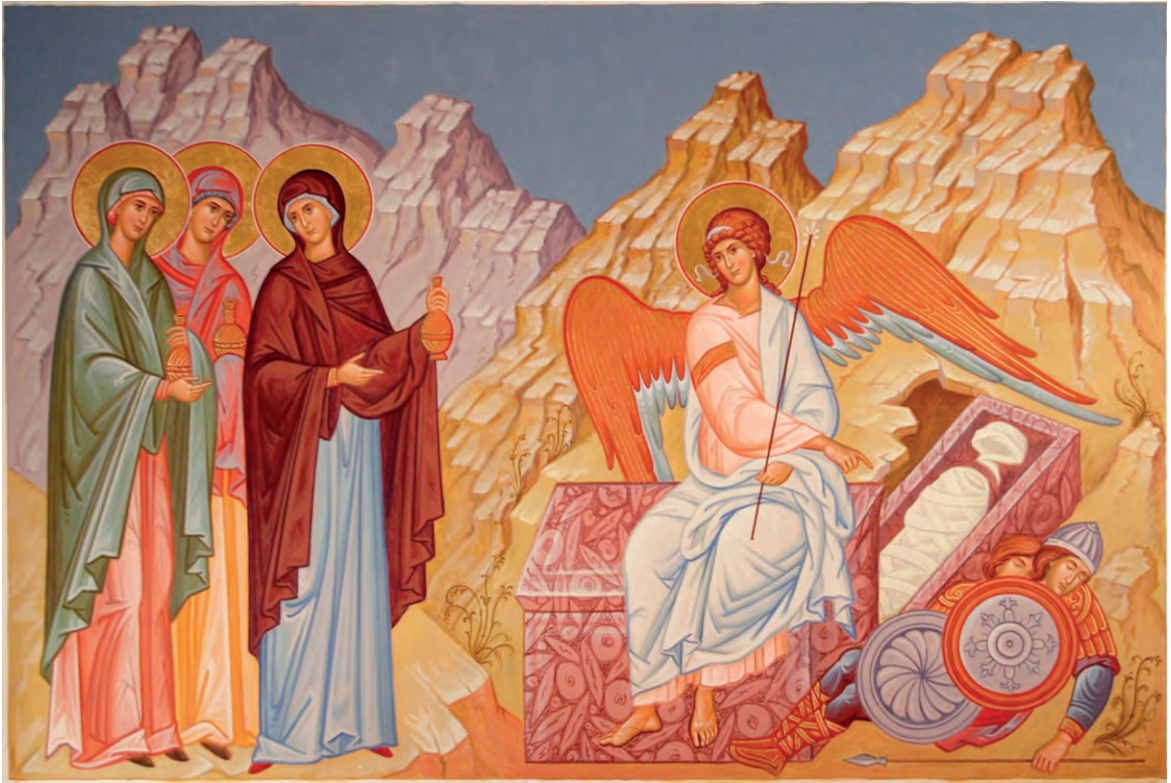
Жены-мироносицы у гроба. Икона

шись светоносного Ангела, стражники пришли в трепет и стали как мёртвые.