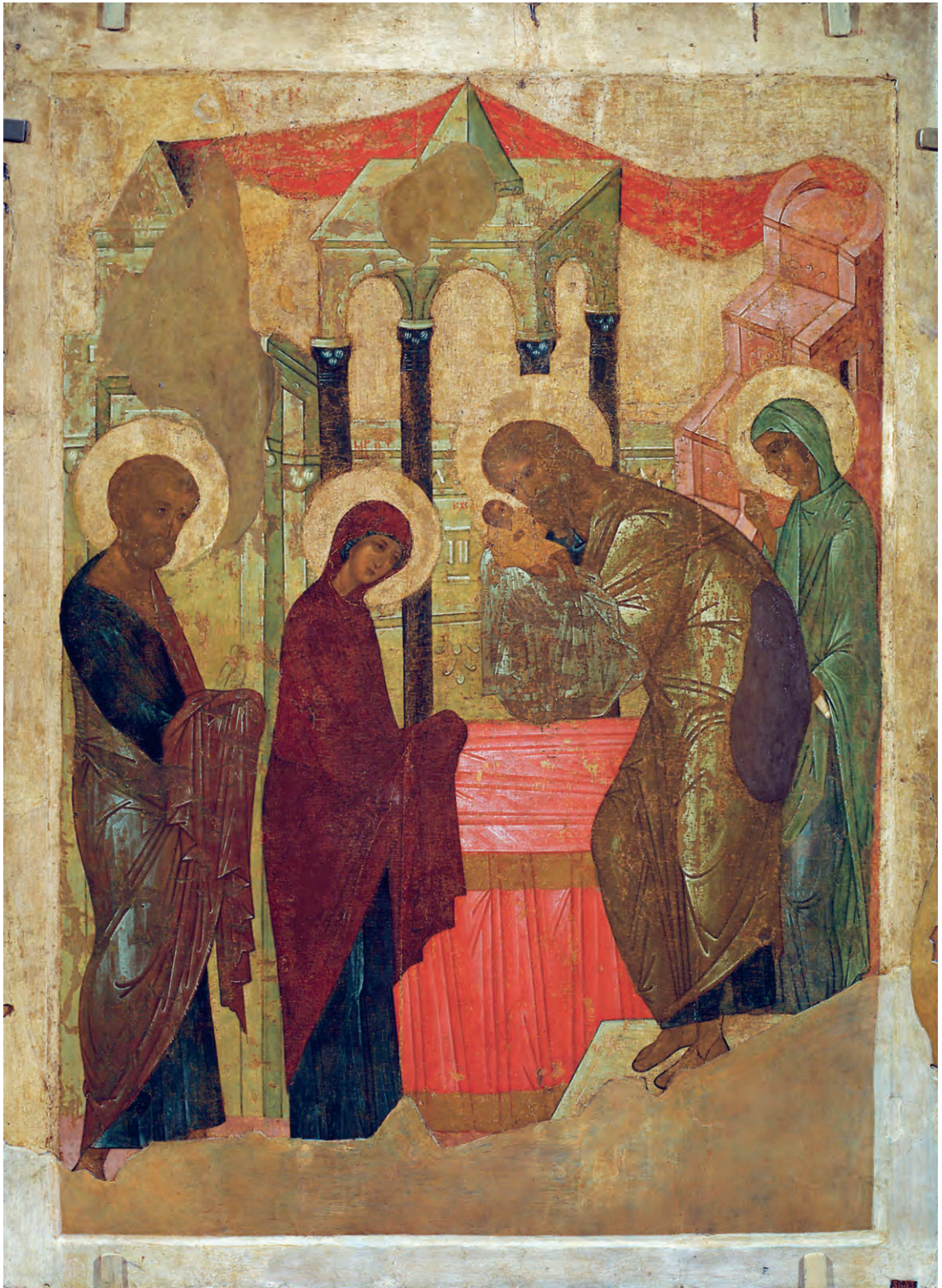
Сретение Господне. Икона. XV в.