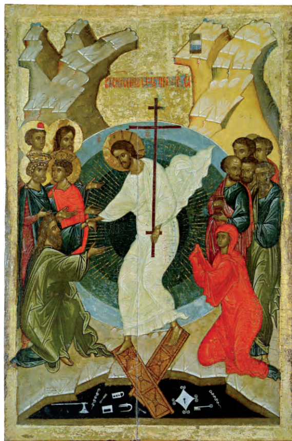
Воскресение Христово. Икона. Псков. XIV в.

А потом ученики Христовы пошли по всему миру, по всем странам и народам, проповедуя о