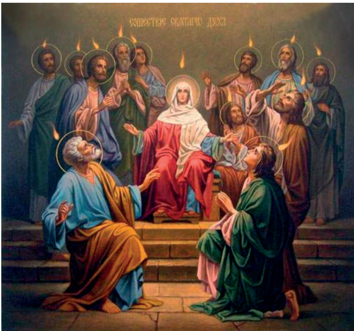
Сошествие Святого Духа на апостолов

Христе распятом и воскресшем из мертвых. Более десяти веков тому назад проповедь о Христе достигла пределов Русской земли. Святой князь Владимир сам принял Святое Крещение, крестил своих детей, а также призвал ко крещению весь свой народ.