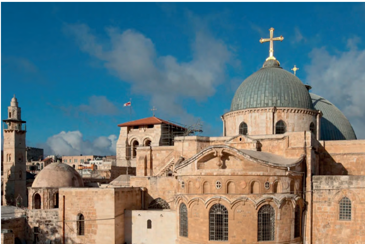
Храм Воскресения Христова. Иерусалим

«Ядро или сущность всего Священного Писания есть Единый за всех и во всех Иисус Христос, и ищущим Бога Он отвергает ум к разумению Писания Духом Святым . Пророки свидетельствуют о Христе Иисусе, Иисус Христос свидетельствует о пророках и дарует Церкви апостолов, апостолы свидетельствуют о Христе Иисусе, о пророках и друг о друге. Дух Святой в пророках и апостолах свидетельствует, что Он в тех и других есть Единый Дух Истины, Дух Христов. Всё Писание богодухновенно, и Дух Божий дышит во всё Писании».