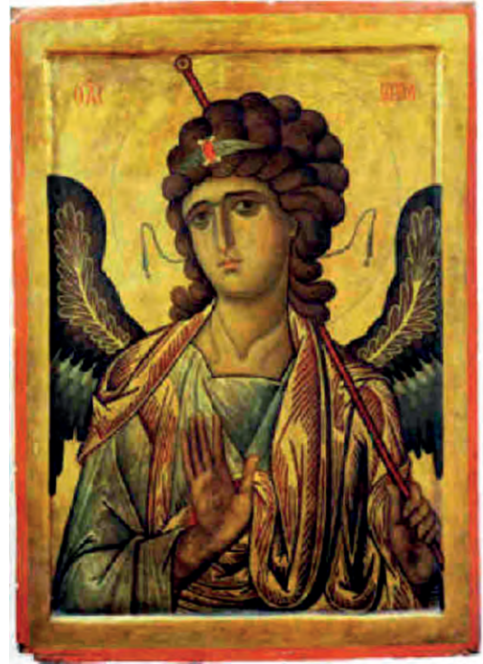
Архангел Гавриил. Икона

В тропаре праздника Благовещения воспевается: «Сын Бóжий Сын Дéвы бывáет, и Гавриíл благодáть благовествúет» . То есть: Сын Божий