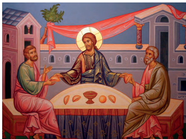
Христос с Лукой и Клеопой в Эммаусе.

Все явления Иисуса Христа по Воскресении имели чудесный характер. Мария Магдалина узнала воскресшего Христа по голосу и лишь потом, ясно увидев Того, Кто говорил с ней, поклонилась Божественному Учителю. Сквозь затворенные двери воскресший Христос вошёл в горницу к десяти закрывшимся от страха уче-