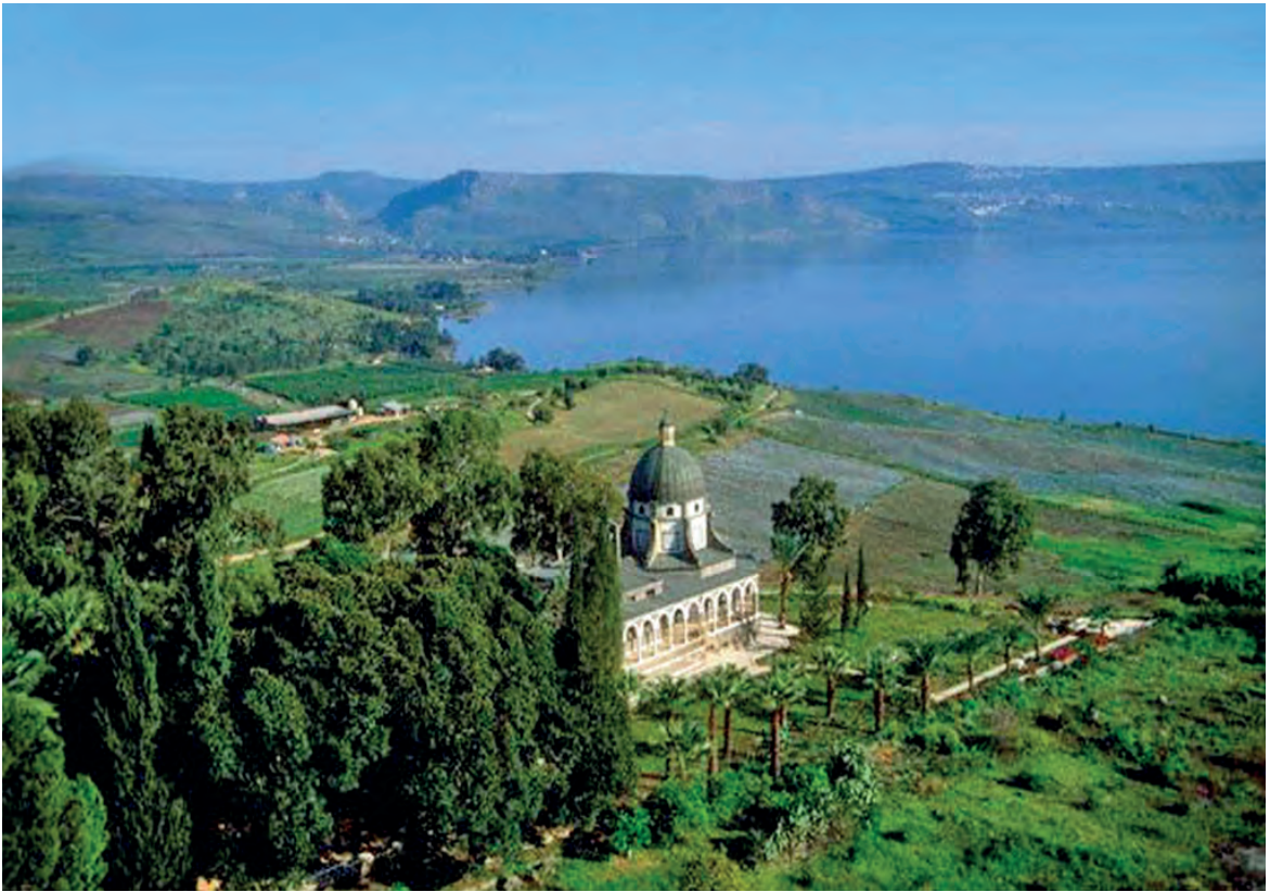
Вид с Горы Блаженств на берег Галилейского моря

шей силы и мужества, способная победить всякое зло, всякую неправду. Кроткий и Всемогущий Христос смертью смерть поправ!