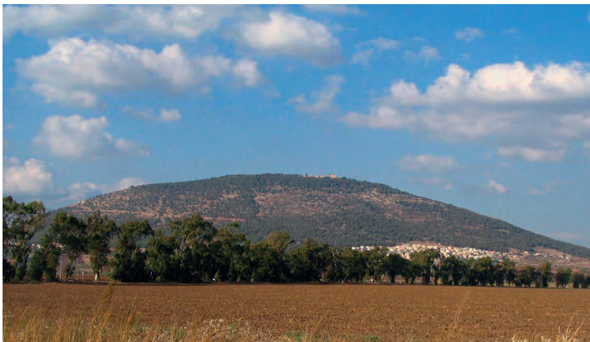
Гора Фавор. Святая Земля

Как учит преподобный Ефрем Сирийский, Господь Иисус Христос явил ученикам Петру, Иакову и Иоанну «Царство Своё прежде Своих страданий, силу Свою прежде смерти Своей, славу Свою прежде поругания Своего и честь прежде бесчестия Своего, чтобы когда будет взят и распят, они знали, что распят не по немощи, но по благоизволению Своему добровольно во спасение миру».