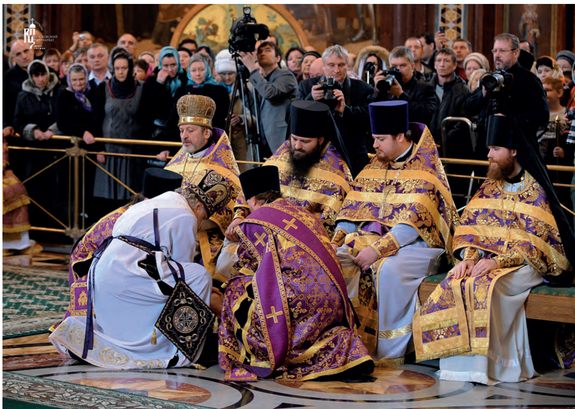
Чин умовения ног в Великий Четверг совершает Патриарх Московский и всея Руси Кирилл

Во время пасхальной трапезы Иисус Христос со скорбью сказал: «Истинно, истинно говорю вам, что один из вас предаст Меня» (Ин. 13, 21). Это был призыв Иуде покаяться, но лукавый ученик не принял слов Христа в своё сердце. Другие же ученики в недоумении стали озираться друг