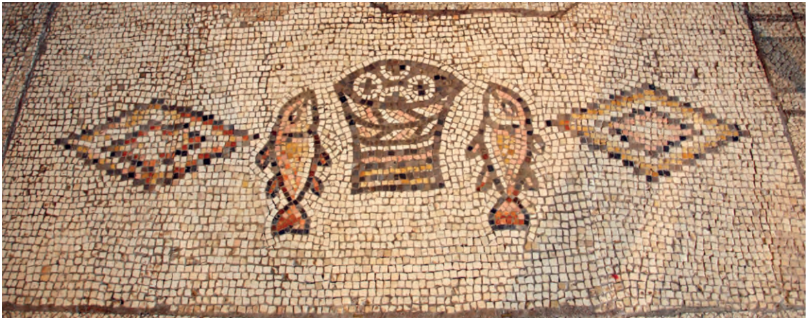
Пять хлебов и две рыбы. Напольная мозаика. Табха. Святая Земля

Истинное значение чудесного насыщения более пяти тысяч человек пятью хлебами раскрылось апостолам на Тайной Вечери. Как повествует евангелист Лука, Иисус Христос, «взяв хлеб и благодарив, преломил и подал им, говоря: сие есть тело Мое, которое за вас предается; сие творите в Мое воспоминание» (Лк. 22, 19).