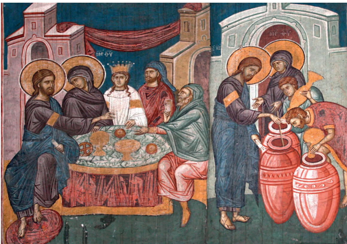
Первое чудо Иисуса Христа. Фреска

Но после этих таинственных слов Христа Спасителя, как пишет евангелист Иоанн Богослов, «Матерь Его сказала служителям: что скажет Он вам, то сделайте» (Ин. 2, 5).