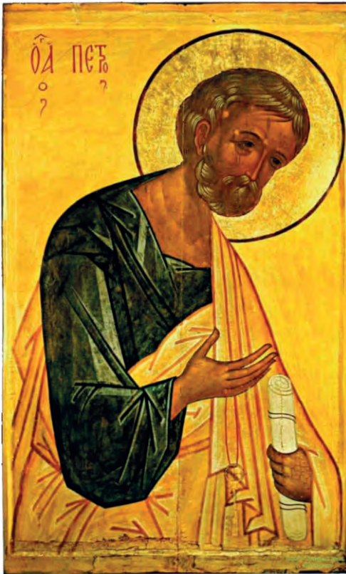
Святой апостол Пётр. Икона

от слёз. Глубоко раскаявшийся Пётр первым услышал от жен-мироносиц радостную весть о Воскресении Христовом. И первым же вместе с апостолом Иоанном поспешил ко гробу своего Учителя.