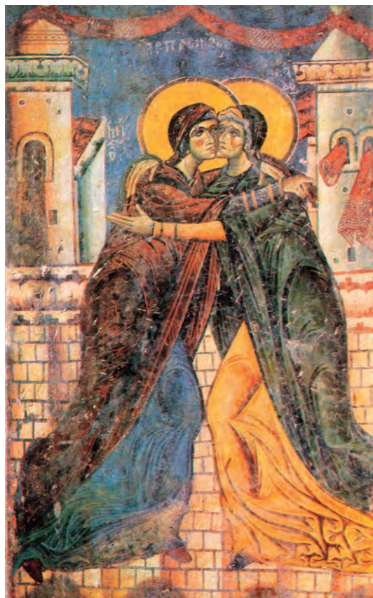
Встреча Девы Марии и праведной Елисаветы. Фреска

Услышав в приветствии Елисаветы слова, сказанные Архангелом Гавриилом, Дева Мария поняла, что тайна Боговоплощения уже открыта Духом Святым её родственнице. Тогда Преплаго-