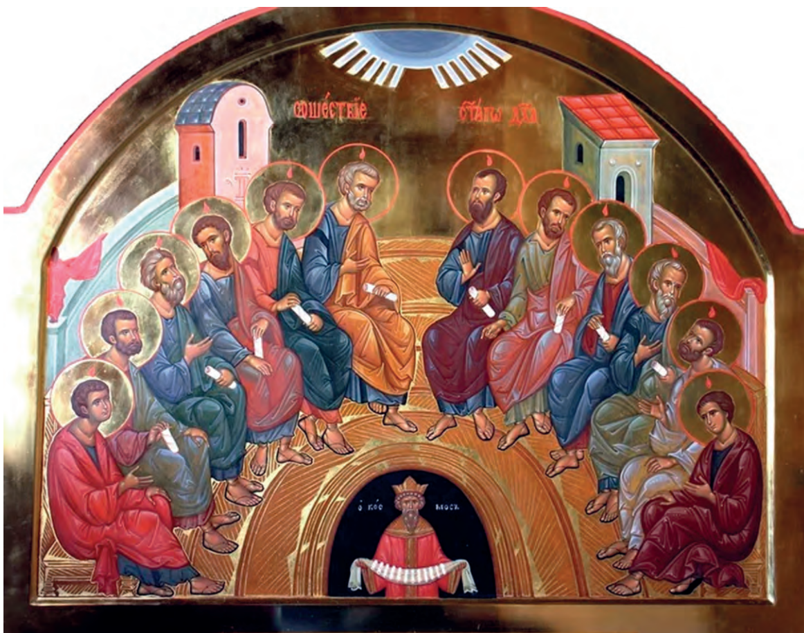
Сошествіе Святого Духа на апостолов. Икона

дальним, кого ни призовет Господь Бог наш» (Деян. 2, 38–39).