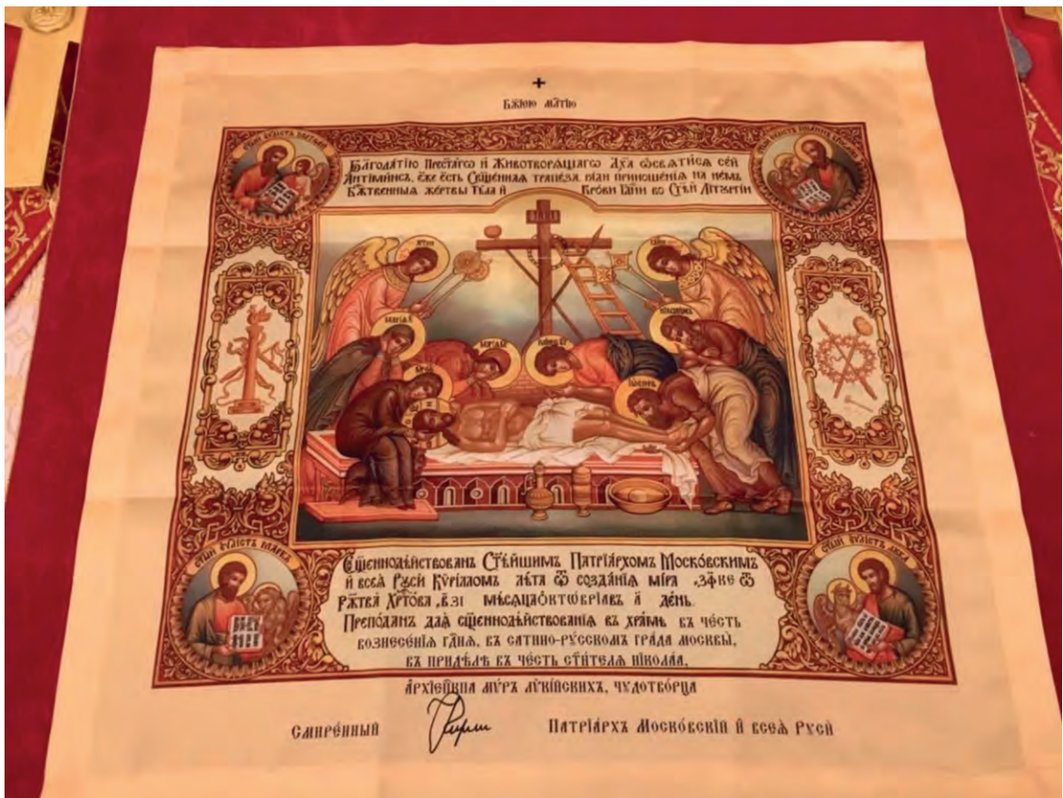
Антиминс на Престоле в алтаре

Его, когда мы спали; и, если слух об этом дойдет до правителя, мы убедим его, и вас от неприятности избавим» (Мф. 28, 13–14).