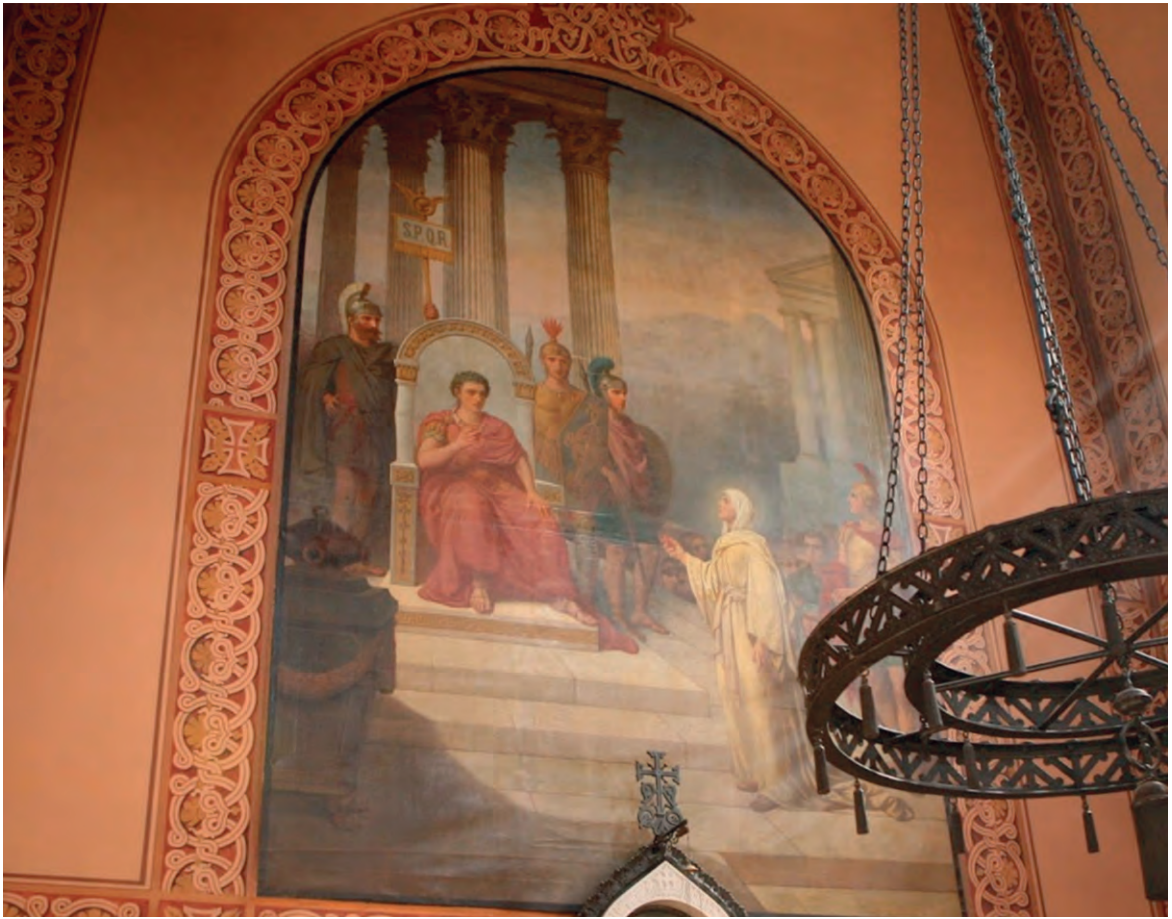
Мария Магдалина у императора Тиберия. В. Н. Верещагин. Роспись храма Марии Магдалины. Иерусалим

Однажды, как говорит предание, Мария Магдалина предстала перед римским императором Тиберием и стала рассказывать о Воскресении Иисуса Христа. Император не поверил и сказал, что воскресение человека так же невозможно, как и то, что белое яйцо вдруг станет красным. И в тот же миг белое яйцо, которое Мария принесла императору, чудесным образом сделалось красным! Так святая равноапостольная Мария Магдалина засвидетельствовала о самом великом