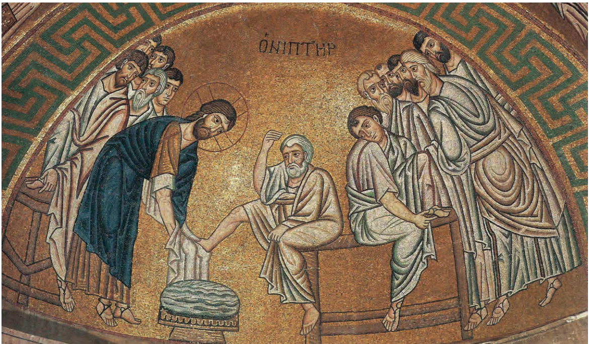
Умовение ног апостолам. Византийская мозаика. XI в.

Когда Иисус Христос подошёл к Петру, тот не захотел, чтобы его Божественный Учитель умывал ему ноги и «говорит Ему: Господи! Тебе ли умывать мои ноги? Иисус сказал ему в ответ: что Я делаю, теперь ты не знаешь, а уразумеешь после. Петр говорит Ему: не умоешь ног моих век. Иисус отвечал ему: если не умою тебя, не имеешь части со Мною. Симон Петр говорит Ему: Господи! не только ноги мои, но и руки и голову. Иисус говорит ему: омытому нужно только ноги умывать, потому что чист весь; и вы чисты, но не все. Ибо знал Он предателя Своего, потому и сказал: не все вы чисты» (Ин. 13, 6–11).