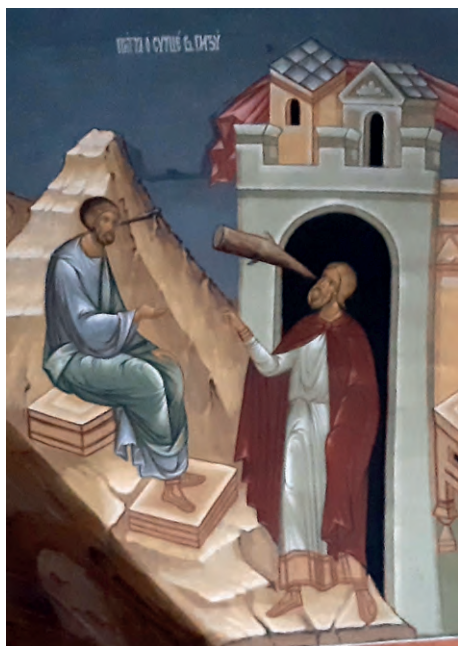
Притча о сучке и бревне

«Что ты смотришь на сучок в глазе брата твоего, а бревна в твоём глазе не чувствуешь? Или как скажешь брату твоему: „дай, я выну сучок из глаза твоего“, а вот, в твоём глазе бревно? Лицемер! вынь прежде бревно из твоего глаза и тогда увидишь, как вынуть сучок из глаза брата твоего» (Мф. 7, 3–5).