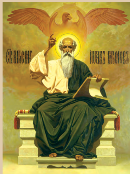
Апостол и евангелист Иоанн