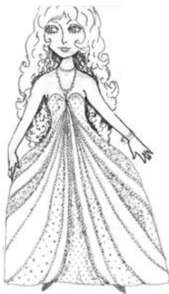
Рисунки Ларисы Николаевны