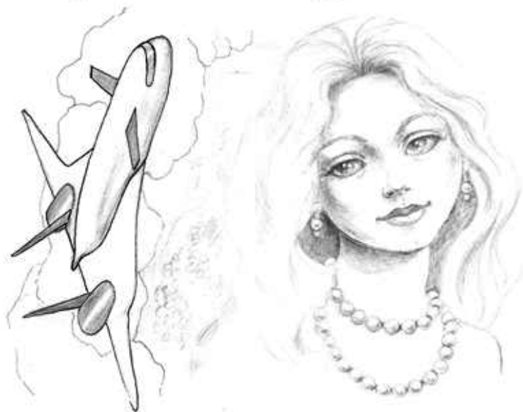
Рисунки Ларисы Николаевны