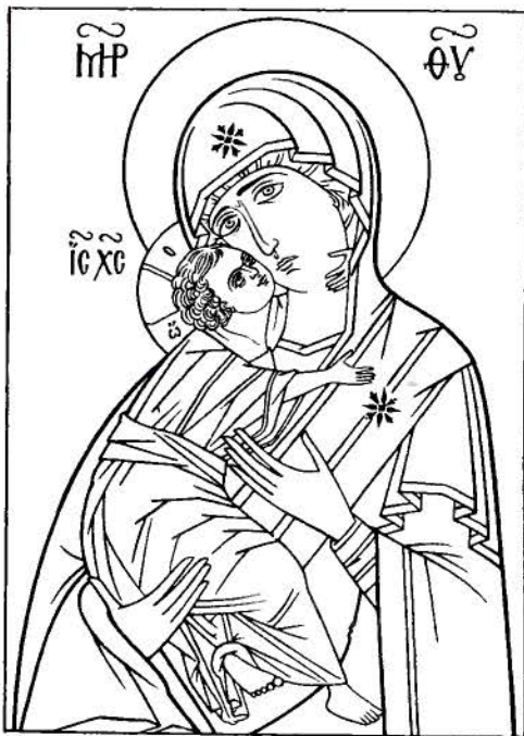
Владимирской иконе Пресвятой Богородицы празднование бывает

Сын Юрия Долгорукого святой Андрей Боголюбский в 1155 году принес икону во Владимир и поместил в воздвигнутом им знаменитом Успенском соборе. С того времени икона получила именование Владимирской. В 1395 году икону впервые принесли в Москву. Так благословением Божией Матери скрепились духовные узы Византии и Руси — через Киев, Владимир и Москву.